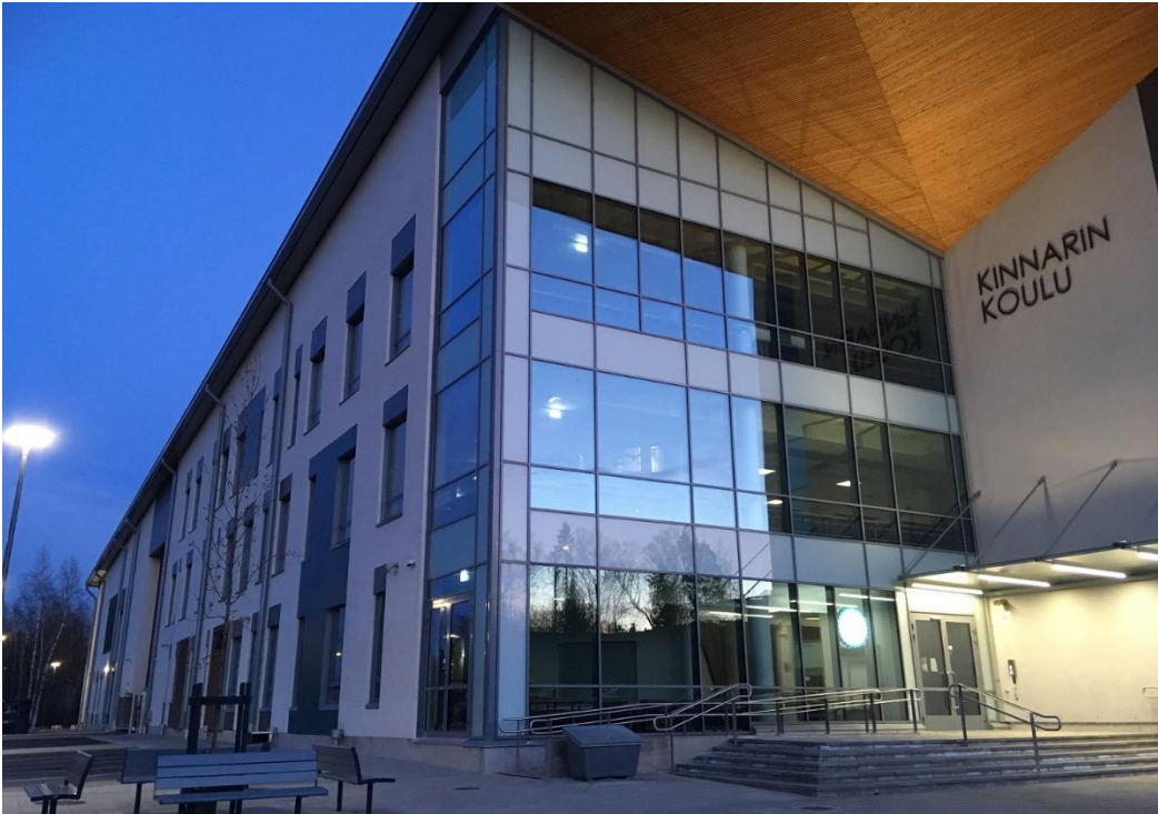
Kuva 3. Uusi Kinnarin koulu avattiin 2019.