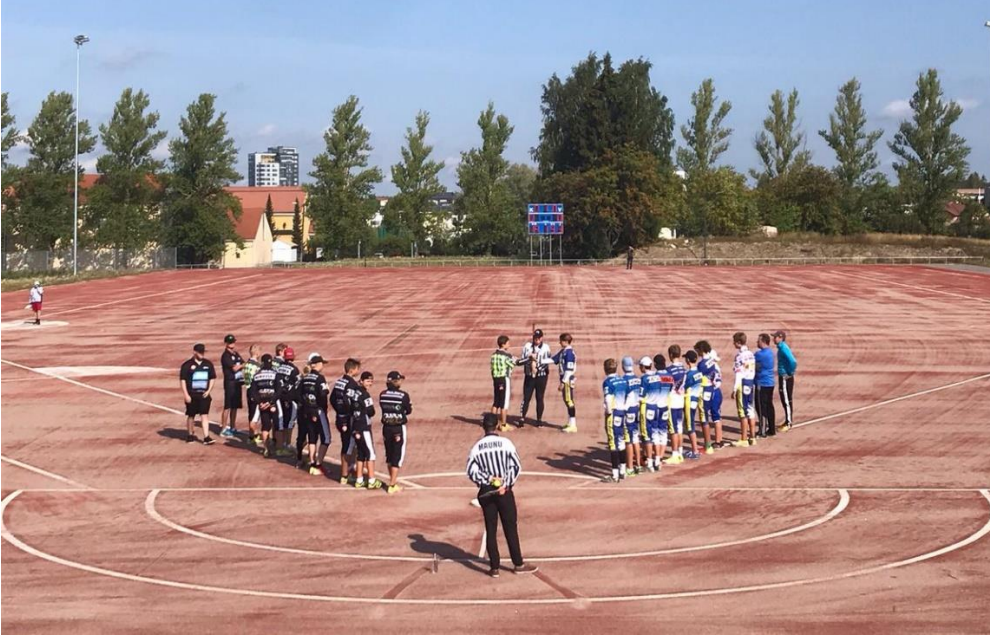
Kuva 5. Juholanmäen pesäpallokenttä rakentuu Lepolan viereen.

Osallisuuden näkökulmasta kaupungin tulisi tukea ja kannustaa kuntalaisia osallistuvaan budjetointiin, kuntalaisaloitteiden tekoon ja muuhun aktiivisuuteen. Mikäli aloitteiden ja ehdotusten käsittely pitkittyy, vesittyy niiden tarkoitus ja motivaatio kuntalaisten aktiivisuuteen.