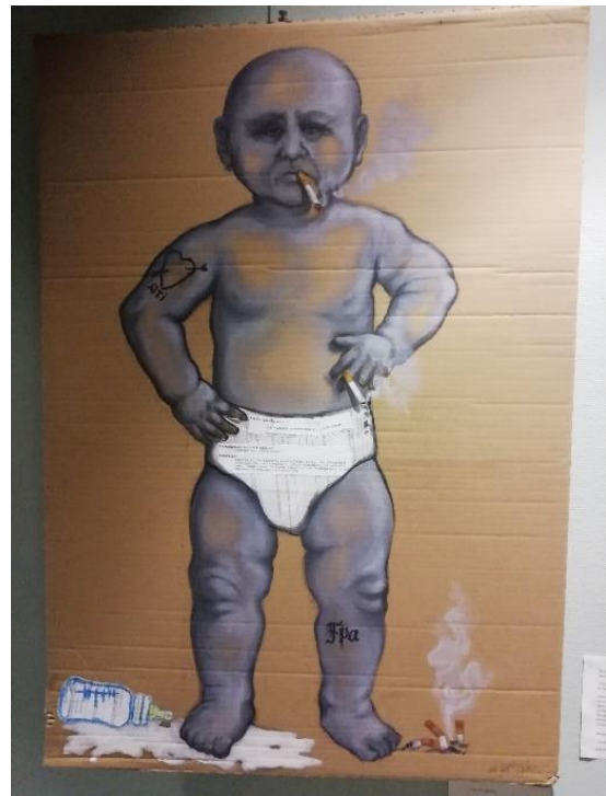
Kuva 4. Nelli Pentikäisen teos Myllytien toimintakeskuksessa.

Hyvinvointilautakunta ja Opetuksen ja kasvatuksen lautakunta ovat aloittaneet laajennetulla kokoonpanolla vuoden 2019 alusta.